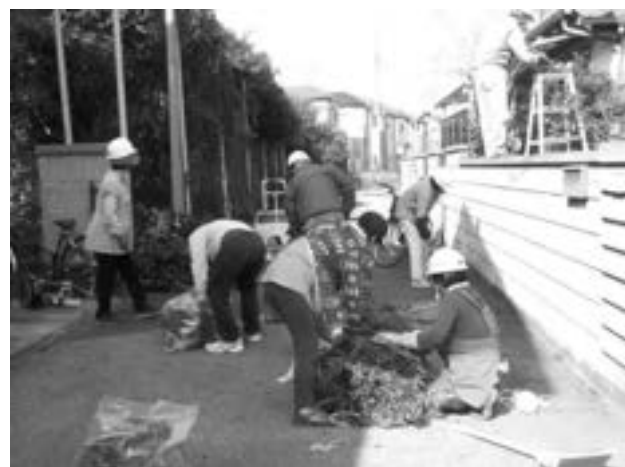
さくしんサポートの会 作業風景