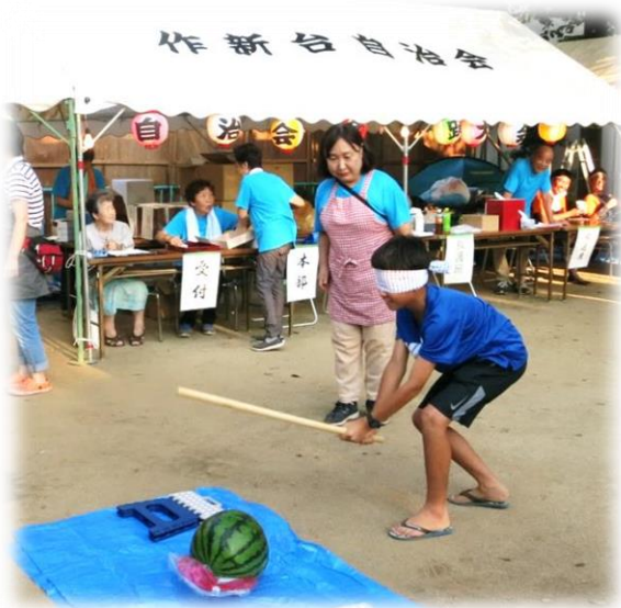
夏祭り盆踊り大会 スイカ割り