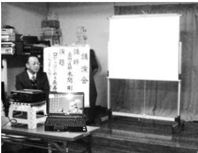
スクリーン、ホワイトボード、 プロジェクター、パソコン