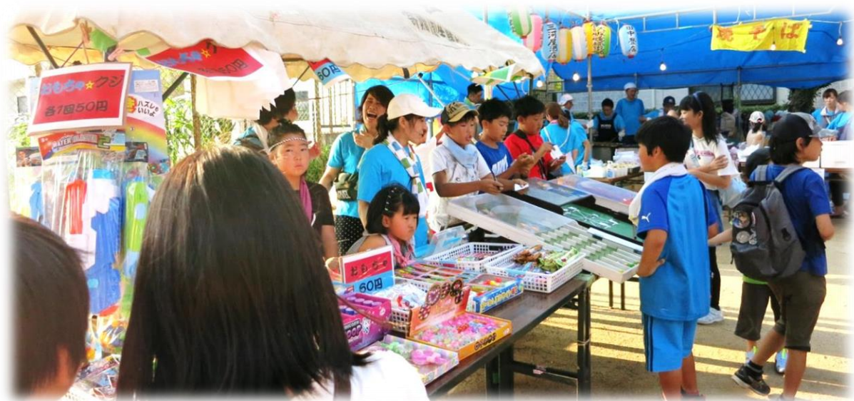
夏祭り盆踊り大会 作新台子ども会売店