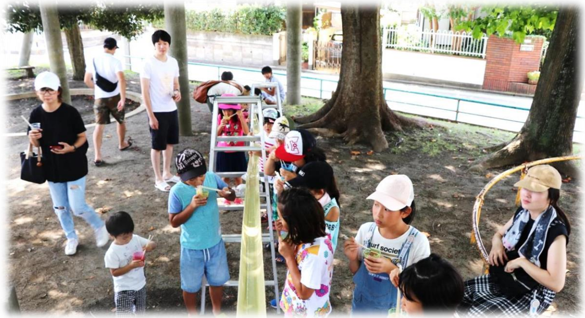
作新台子ども会 そうめん流し