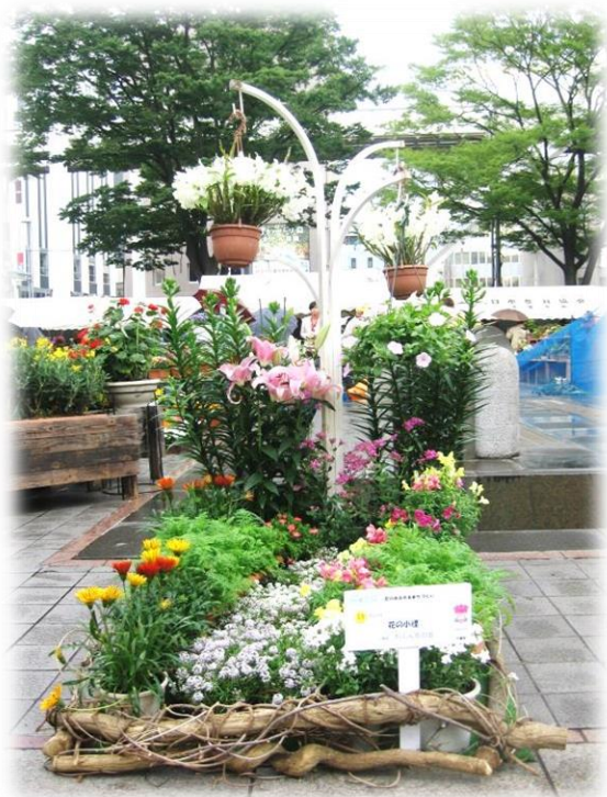
第1回千葉市コンテナガーデンコンテスト 千葉市長賞 (平成 23 年 5 月)