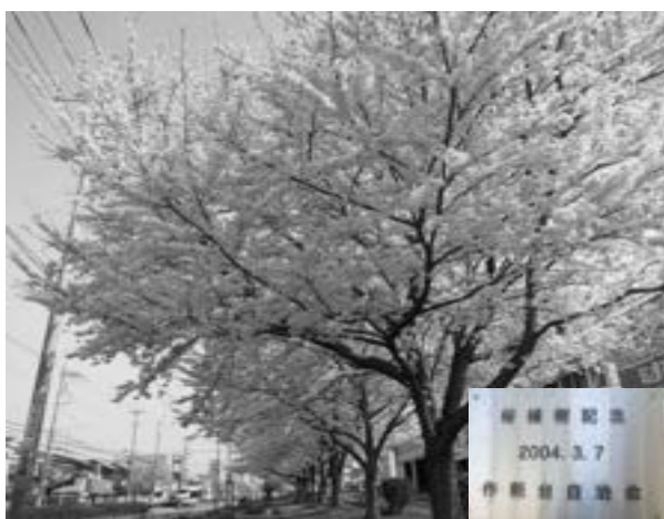
千葉市移管 桜の木