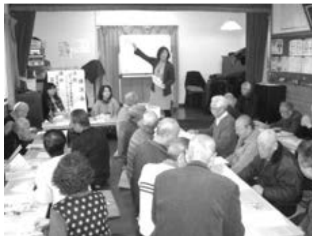
花見川保健福祉センター 講師による健康講演会