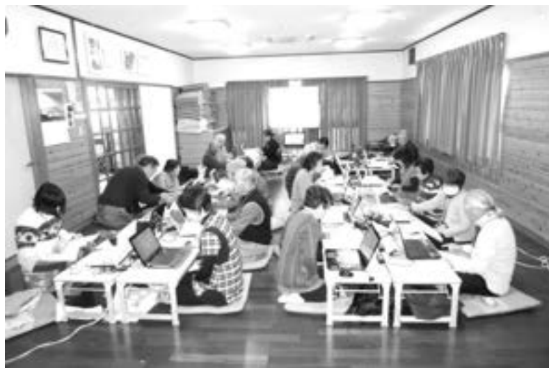
さくしんパソコンクラブの学習風景