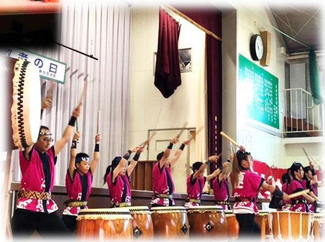
作新台自治会 敬老会