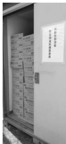
防災用備蓄食料倉庫