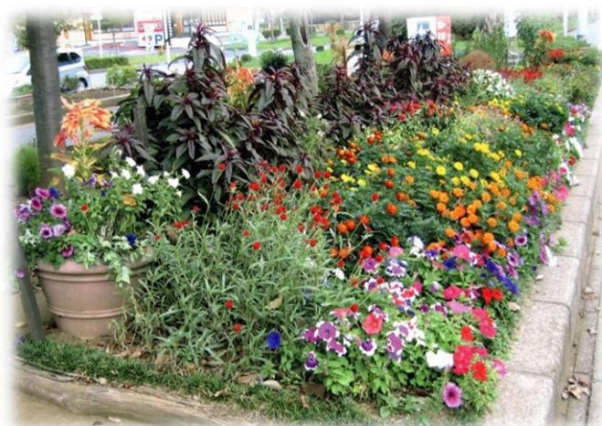
第 31 回千葉市花壇コンクール 千葉市議会議長賞 (平成 24 年 11 月)