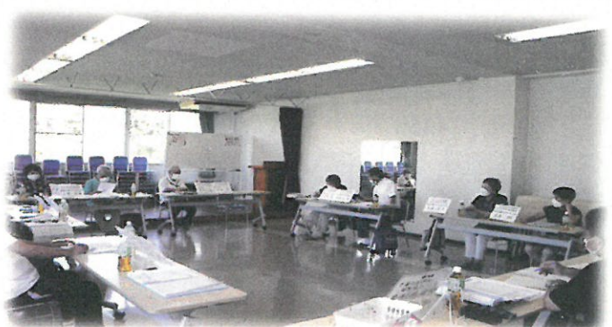
地区部会月例常任理事会 (長作公民館 講堂)