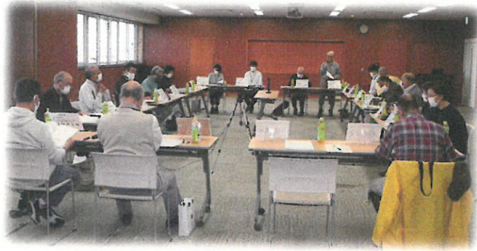
地区部会月例常任理事会 (花見川区保健福祉センター)