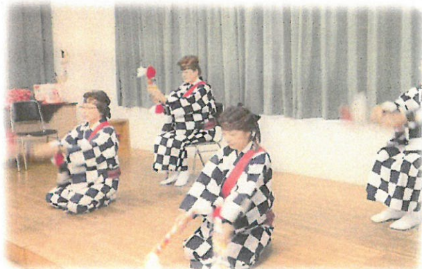
天戸中学校区地区部会で特色のある事業を開催し高い評価を頂いている(ふれあい食事会)開催風景