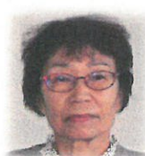
児童福祉委員会委員長(代行)