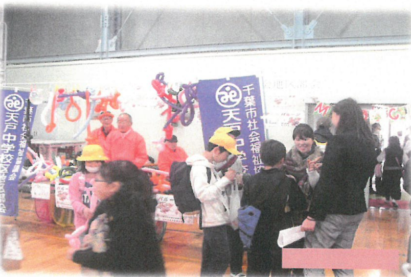
福祉活動推進懇話会の長作小学校はばたき祭「ハルーンアート出店」(千葉市立長作小学校)