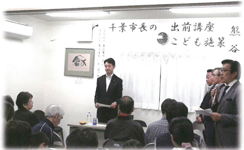
千葉市の子供施策についての説明会 (長作町貝塚町会 会館)