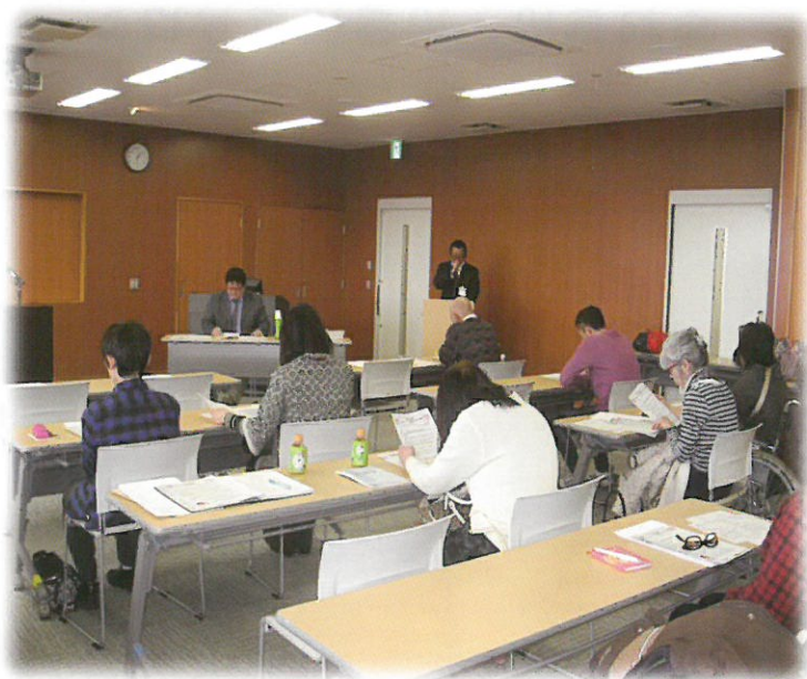
【活動を再開しています】花見川区主催ボランティア講座に地区部会が参加しました。(花見川区保健福祉センター)