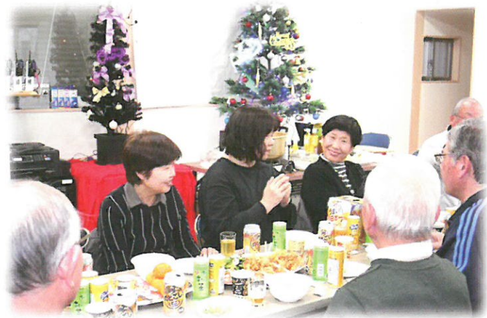
11年間 1回も休まず続けている福祉活動推進懇話会 月例会議

※福祉活動推進員は千葉市社会福祉協議会会則の第10条に福祉活動推進員を「福祉活動推進員設置要綱」に基づき設置されています。現在委員数は14名(内病気・介護で4人が休職中、実働者は10名です)