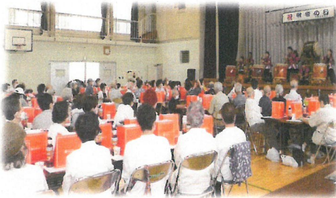
3年ぶりに再開された敬老祝賀会 (作新台自治会) 左と