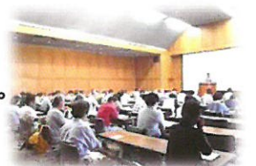
市主催の講座への参加

地区部会活動を行うにあたって、ボランティアの存在は、欠かせません。このため、市・区開催の講座に参加して習得に努めています。