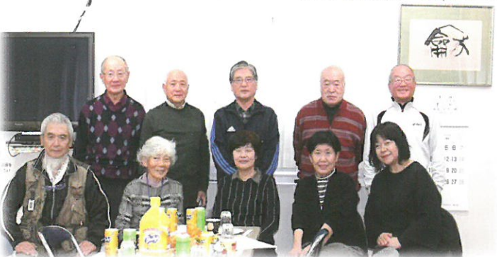
福祉活動推進懇話会100回記念月例会風景

千葉市社会福祉協議会 天戸中学校区地区部会 福祉活動推進懇話会 100回記念・定例会2022.11.11