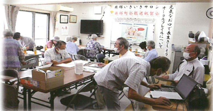
【活動を再開しています】今期から再開された「門原いきいきサロン」「かいつかいきいきサロン」の開催風景