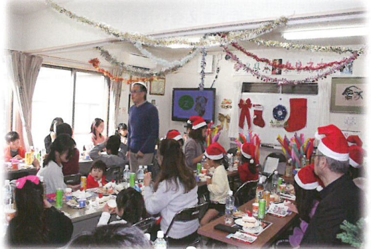
近隣の子供達を招待して恒例のクリスマス会の開催 長作町貝塚町会 会館