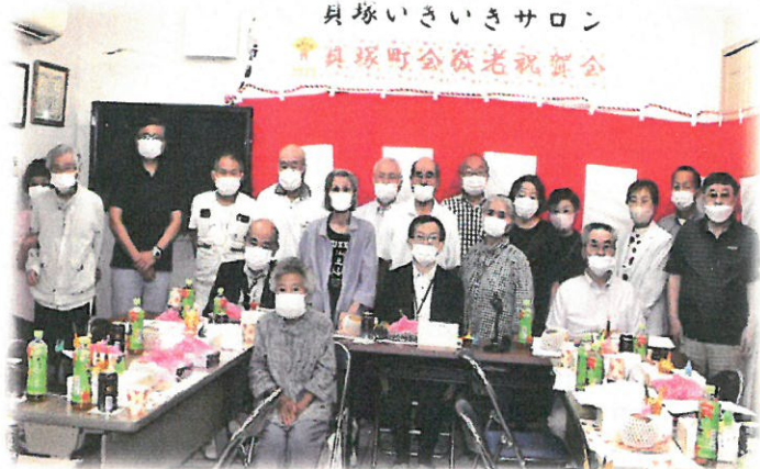
(長作町貝塚町会) 右