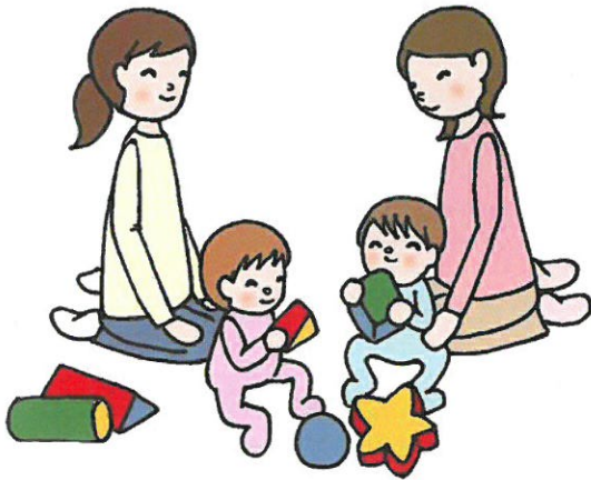
子育てサロンのイメージイラスト

公共の施設や町内自治会館等を会場に、子育て中の親子が気軽に参加し、自由に遊んだり、おしゃべりや、情報交換をして、子育てを楽しみながら仲間づくりを進める活動です。