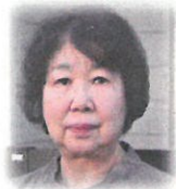
高齢者委員会委員長(代行)