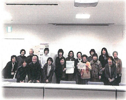
千葉市支え合い活動団体連絡会

千葉県社会福祉協議会 花見川区事務所連絡先 所在施設：千葉県 花見川保健福祉センター 所在地：〒262-0026 千葉県千葉市花見川区瑞穂1-1 電話：043-275-6438