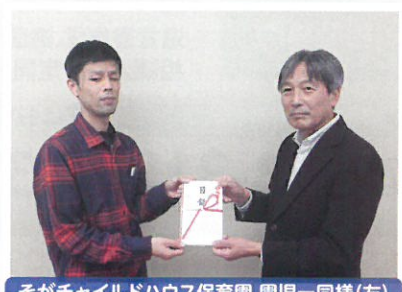
そがチャイルドハウス保育園 園児一同様(左)