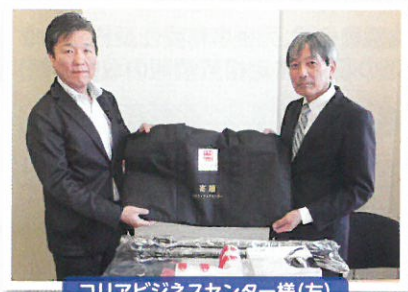
コリアビジネスセンター様(左)