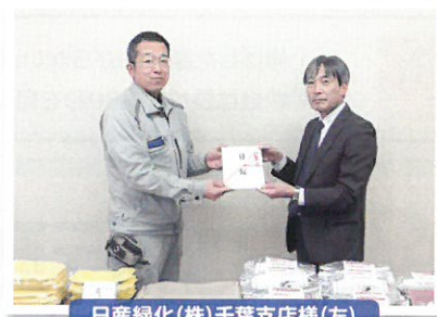
日産緑化(株)千葉支店様(左)