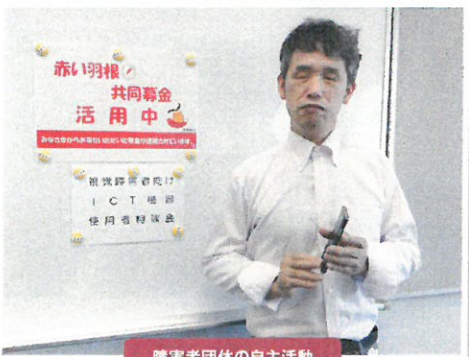
障害者団体の自主活動