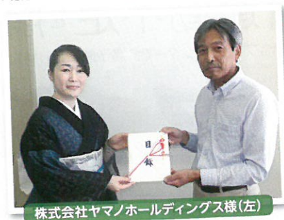
株式会社ヤマノホールディングス様(左)