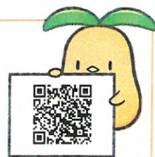
千葉県共同募金会 マスコットキャラクター「びびよ」