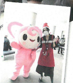
ハーティちゃん和記念撮影