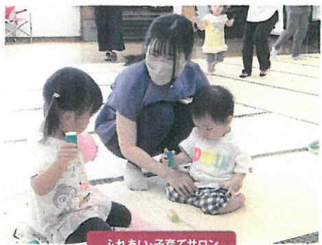
ふれあい子育てサロン

赤い羽根共同募金は、「じぶんの町を良くするしくみ。」のテーマに沿って、募金額の約7割が千葉市へ、約3割が千葉県の地域福祉活動に役立てられています。