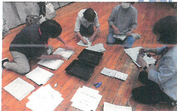
抜群のチームワーク！お互いを支え合います。(社協まつりの準備中)