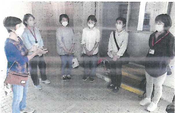
地区部会長と福祉活動推進員の皆さん。素敵なお話しに心が温まります。