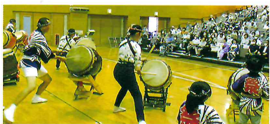
▲長寿を祝い交流を深めます

区域内で開催される敬老祝賀会へ協力しています。そのうちのひとつ、千葉寺青葉町自治会では和太鼓、フラダンス、社交ダンス、大正琴など演者は地元の方々です。加えて町内自治会、民生委員など住民同士が連携、協力し、温かくにぎやかな会が催されています。