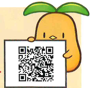
千葉県共同募金会 マスコットキャラクター 「びわびよ」