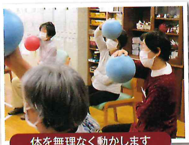
体を無理なく動かします