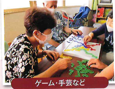
ゲーム・手芸など