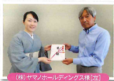
(株)ヤマノホールディングス様[左]