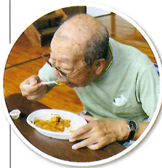
▲部長もいただきます!

完成したカレーは小学校の体育館で振舞われます。会場は地域の子もたちで大賑わい。カレーを待つ間には高校生のボランティアのお兄さんお姉さんが遊んでくれました。