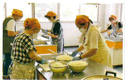
▲調理場では連係プレーが光ります

抜群のチームワークで、100人以上のカレーを作っていきます。今日はキーマカレー。なすとコーン入りです。チキンカレーやドライカレーなど、毎回色々なカレーを作ります。