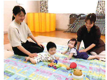
千葉市社会福祉協議会地区部会が行う子育てサロンの様子です。