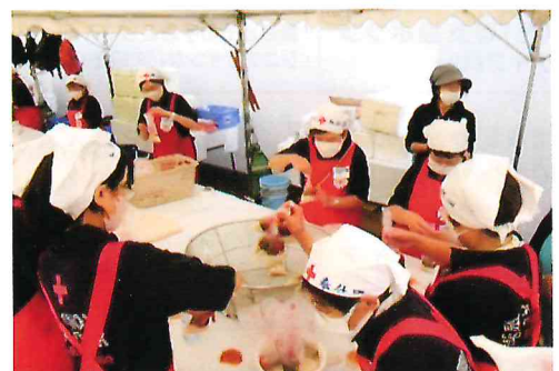
写真は九都県市防災訓練での炊き出しの様子です。

日本赤十字社 千葉県支部千葉市地区本部(千葉市社会福祉協議会内) 〒260-0844 千葉市中央区千葉寺町1208-2 千葉市ハーモニープラザ3F TEL:043-209-8867 FAX:043-312-2442