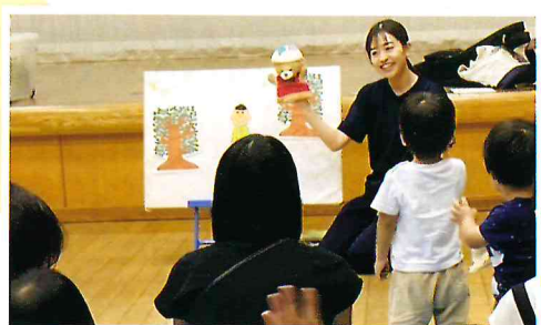
▲すてきなすてきなぼうしやさん(保育士さんによるパネルシアター)

「子育て中のお父さんお母さんの居場所づくりをしよう」の声から活動が始まりました。地区部会のスタッフをはじめ、ギターやレク、工作等で活動を長く支えてくださる方々、