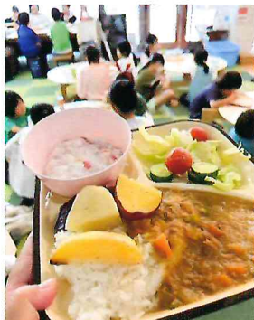
地域の居場所づくりに関する活動を行う団体の活動資金として活用しました。写真は、子ども食堂の様子です。