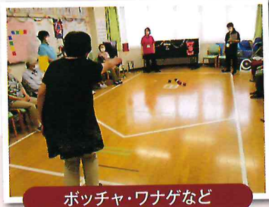
ポッチャ・ワナゲなど