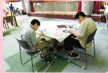
▲ちぎり絵作業に熱が入り楽しそうに取り組んでいます。

ボランティアの募集もしています。ボランティアには、自分の意志でお手伝いに来てほしいし、職員は率直な意見を頂きたいそうです。ある車椅子利用者の男性は、「普段は音楽やDVDを楽しんで過ごしています。行動範囲を広げたくて、家族や職員と相談して外出します。ボランティアさんと気が合えば、週末と一緒に外出できると嬉しいです。」と話してくれました。