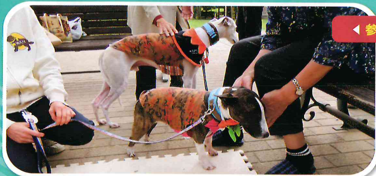
◀ 参加者の皆さんを癒してくれるワンちゃんたち