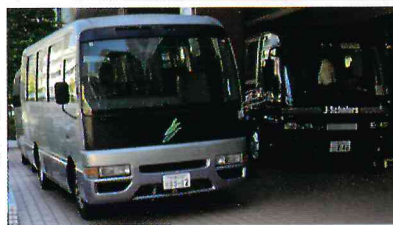
◀ 地域と会場をつなぐ送迎バス

地区部会としてもフレイル予防を鑑みた活動を目指し、地域の皆さんが少しでも外出しやすい形に、そして、皆さんとの交流も深めてもらいたいと思っています。そうしたことを具現化させるために会場まで4台の送迎バスを手配し、民生委員や福祉活動推進員がサポートしてスムーズに移動ができています。