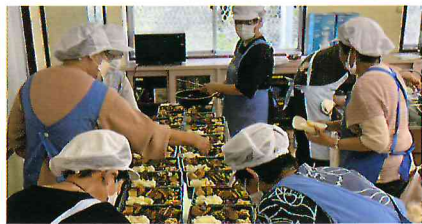
▲気持ちを込めて、参加者の皆様へ

毎月第3水曜日にふれあい食事会を開催しています。厨房では、作るメニュー毎に担当が4か所に分かれ調理を進めます。食材の中には、家庭で採れた野菜も。参加者が食べやすいように、鮭の皮を強めに焼いたり、すだちの種を取り除いたり、細やかな気配りを感じます。大量の調理をするには、臨機応変な対応が必要となることもあります。食事を通じて参加者の笑顔につながれば、一致団結します。