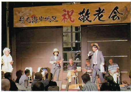
▲参加者参加型の余興で大盛り上がり! 麦畑〜♪

コロナ禍により令和2年から開催を見送っていた敬老会。たかが3年間実施しなかっただけで、地域の希薄化は大きく広がってしまいました。それを解消すべく、中学校の体育館からホテルの宴会場に会場を刷新して、きらびやかな会になるように取り組んでいます。