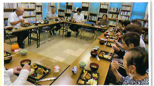
▲思い出話に花を咲かせながらいただきます

食事会では「おいしい!」という声とともに笑顔があふれます。この日は、食後に「心象風景」と題して思い出を語りあった後、近隣の高齢者福祉施設の理学療法士さんによる頭も使った運動、最後には懐かしい歌をうたい楽しい時間を過ごしました。