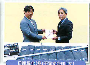
日産緑化(株)千葉支店様 [左]