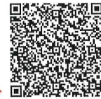
アウトリーチ支援員▶