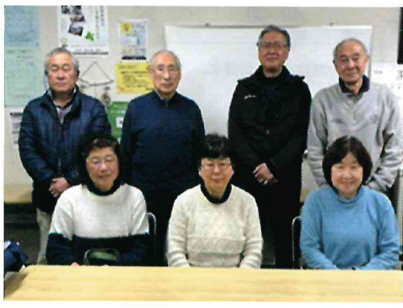
実行委員会のメンバー